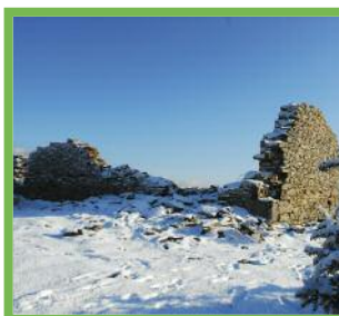
The ancient chapel of Olhain

La Capilla de Olhain se encuentra en medio de las ruinas de un reducto con forma pentagonal, en el que dos de los lados miden más de 25m (extraído del libro "Autrefois Sara" de J.Antz, ed. Atlantica 2005).