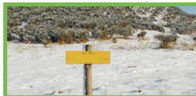
Señalización a pie del reduto de Olhain.